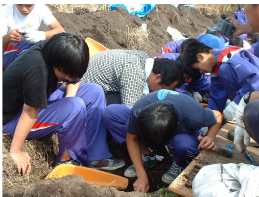
港町1遺跡における中学生の発掘体験