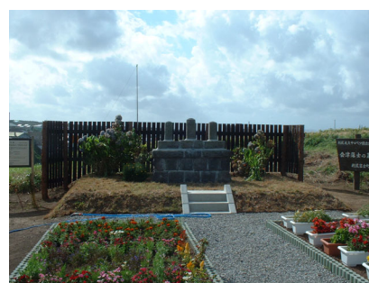
会津藩士の墓（ペシ岬）

9/1～22 港町1遺跡発掘調査（港町 140・141 番地、縄文時代中期の集落）