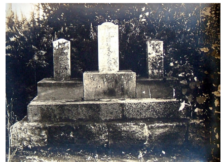
本泊墓碑のようす（明治45年）

また、法要の期日8月27日は、春温の没した文化5年戊辰7月6日を太陽暦に換算した日である。